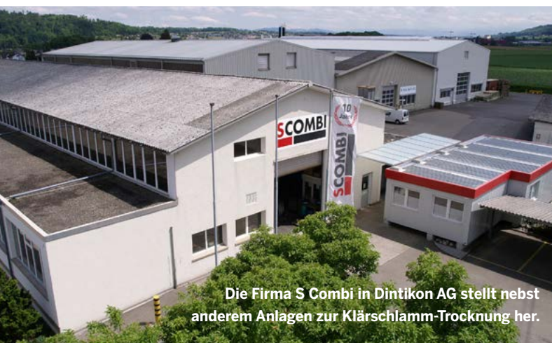
Die Firma S Combi in Dintikon AG stellt nebst anderem Anlagen zur Klärschlamm-Trocknung her.

Auftragsfertiger setzt beim ERP-System auf Durchgängigkeit. Den Schweizer Fertigungsunternehmen der Metallbranche weht eine steife Brise entgegen. Eurokrise und Billigkonkurrenz fordern den Produktionsbetrieben alles ab. Zu den Betroffenen gehört der seit über 40 Jahren erfolgreich im Apparate- und Anlagenbau sowie in der mechanischen Fertigung tätige Metallbearbeitungsbetrieb S Combi. Hilfe kommt vom Abacus ERP- und PPS-System.