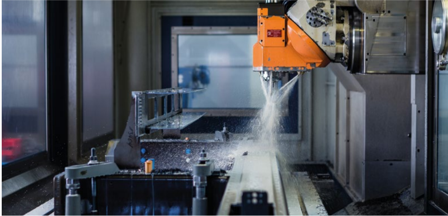
Die übersichtliche Nachkalkulation der Produktionsaufträge hilft bei der Bewertung und Kontrolle der Aufträge.